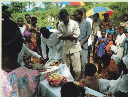
有志たちから金が集められる

さつきとは違うおおぶりの太鼓が打ち鳴らされるなか、遺体が納められた柩は白い布でつられ、穴の中にゆっくりと下ろされた。トタンがかぶせられた柩の上