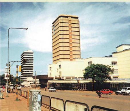
首都カンパラの中心部

病や死の原因への関心は、人類の普遍 的な現象だろう。なかには仲間の死に際 してなにがしかの儀礼を行うかどうか 動物と人間との差であり、「死」の儀礼の 有無をもって「文化」概念に代える研究