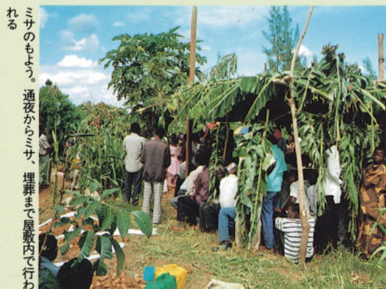
ミサのもよう。通夜からミサ、埋葬まで屋敷内で行われる