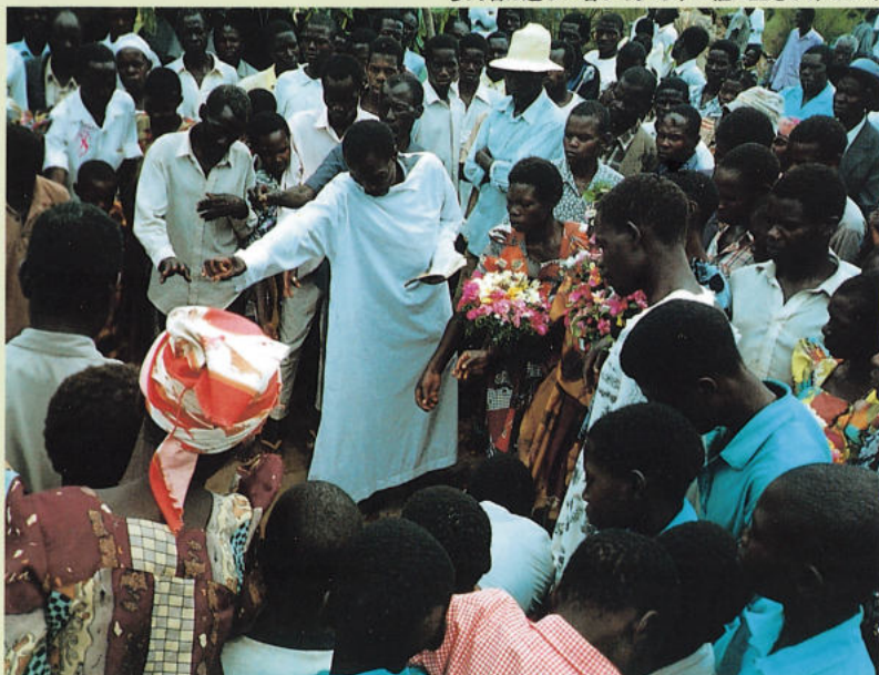
参列者は近い者から少しずつ柩に土をかけていく