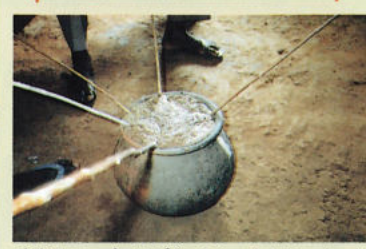
醸造酒コンゴ。100%のミレットからつくったものが上等とされる