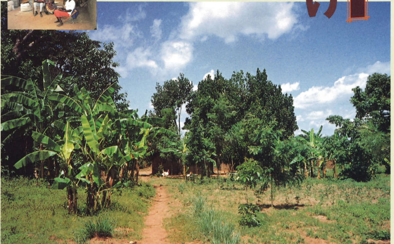
滞在したトロロ・ディストリクトのボーダー村

日本学術振興会特別研究員、一橋大学大学院博士課程(社会人類学)、ウガンダ・マケレレ社会研究所準研究員