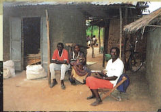
ブシヤ村の人々。飲んでいるのは自家製焼酎ワラギ